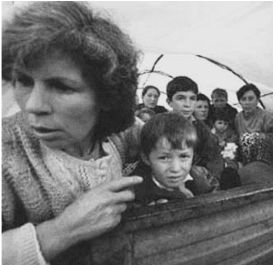
Les imatges de la població civil afectada pels conflictes han de constituir memòria col·lectiva per tal d'avançar en els processos de justícia internacional

La creació de la CPI és una satisfacció, però hem de ser conscients que