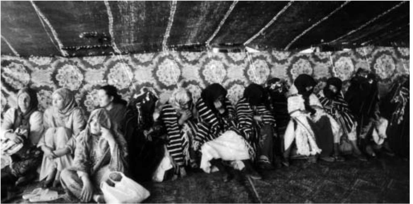
A certes regions les núvies esperen reunides fins el moment d'emparellar-se

les línies familiars, dels llinatges, aspecte que seria corroborat per l'existència del dot, entès com la compensació econòmica que rebia la dona per participar en la consolidació d'un nou matrimoni i no com sovint s'ha analitzat de compra-venda de dones. Aquesta constatació ens portaria a defensar que, en la societat marroquina (com en d'altres societats àrabomusulmanes), existia un parentiu oficial patrilinial (d'homes) i un parentiu pràctic cognatí (de tots dos sexes).