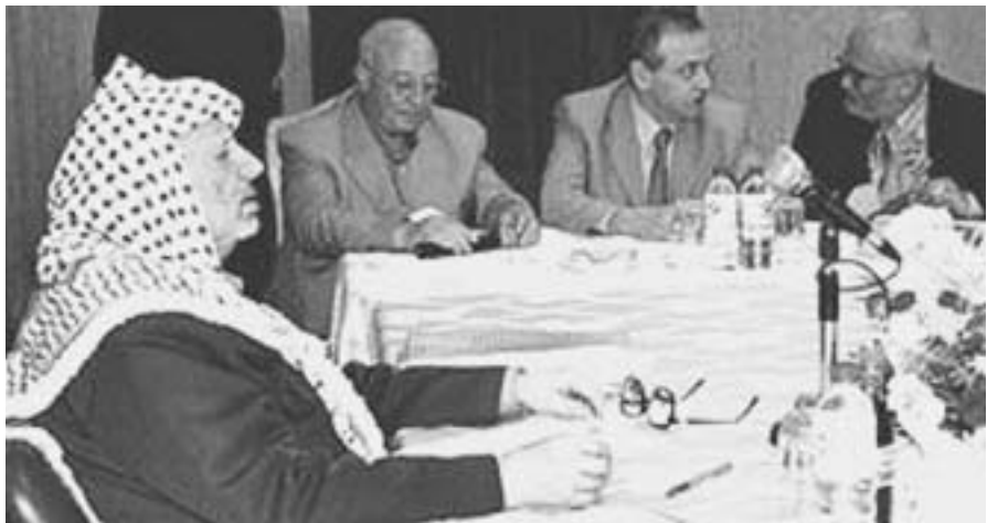
La discussió ideològica va més enllà de la religió i els sistemes polítics.

a una pau permanent. O no hi tenen res a fer les ciutats? (Són els estats els que s'enfronten, no els ciutadans!). I des de les universitats, està tot experimentat en els diferents camps propis? I els partits i sindicats des de les seves instàncies internacionals, però també des de l'àmbit local, hi han fet tot el possible? I les organitzacions civils tenim prou imaginació i recursos per endegar iniciatives noves?, sabem anar més enllà de la protesta puntual? Fins quan seguirem atomitzant i diversificant el món de les ONG i ens posarem d'una vegada per sempre a coordinar esforços amb eficàcia a favor, en aquest cas, d'una causa comuna a molts i que