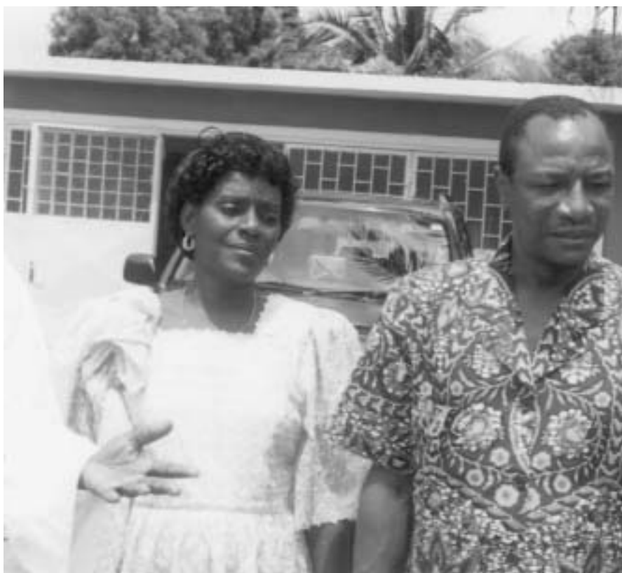
Alpha Conde, a la dreta, en una visita a Burkina Faso

En definitiva, la qüestió que cal plantejar és la de saber si aquesta proposició s'acompanyarà del coratge responsable de les autoritats de Sud-àfrica. Aquestes havien jutjat que era vital per a l'estabilitat de la consciència comunitària –després de les atrocitats del règim de