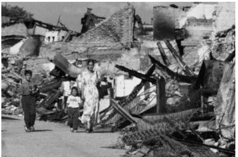
Els països involucrats en afers ètnics són els més reticents a donar suport a un Tribunal que podria condemnar alguns dels seus dirigents

només se n'han construït les bases i sota moltes pressions. Cal seguir lluitant, des de la ciutadania i les entitats, perquè els objectius es vagin complint però també per