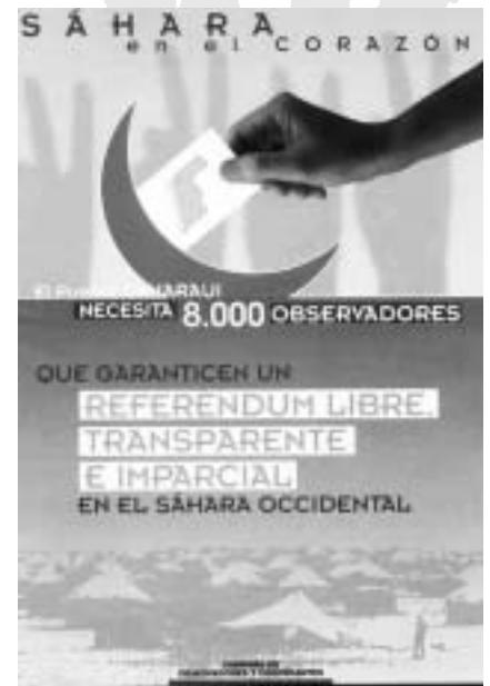
Les movilitzacions respecte la situació del Sàhara delata la seva complexitat

Les forces del Consell de Seguretat estan equilibrades i es fa difícil trobar una solució. No es pot imposar una sortida que estigui en contra de la voluntat del poble sahrauí.