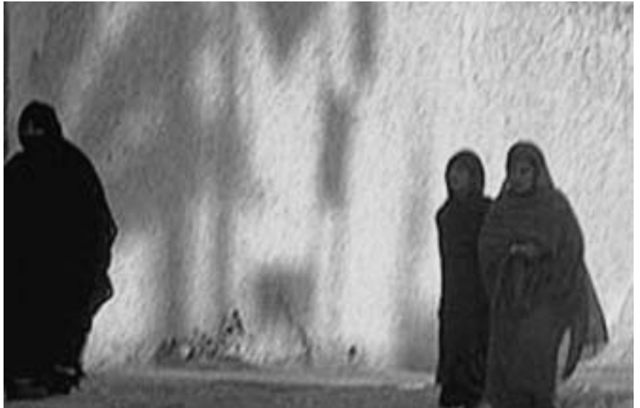
El paper de la dona marroquina dins la seva societat és de difícil definició

Històricament, s'ha estat defensant el fet que les dones marroquines vivien en una societat patriarcal,