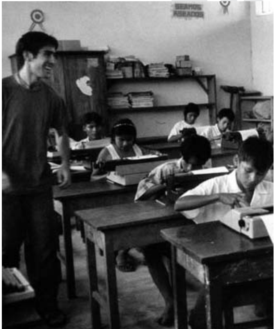
Les dures condicions de la selva frena els mestres, que provenen en la seva majoria de les ciutats

Com hem esmentat abans, les jornades educatives també han estat encarades als joves i adults. Hem realitzat cursos de mecanografia, informàtica, redacció de documents i costura, com a resposta a les seves demandes. Paral·lelament, mantenint una continuïtat amb el camp de treball del 2001 en l'aspecte sanitari, hem donat un curs de laboratori per als promotors de salut d'aquestes comunitats, centrat en la detecció de la malària, malaltia que provoca estralls entre la població indígena.