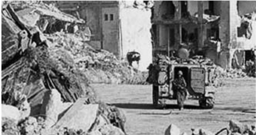
L'opció militar és la menys indicada per l'espiral de violència i repressió que provoca

Cinquè. El món local, les institucions acadèmiques, els partits i els sindicats, l'associacionisme cívic d'ambdós costats del conflicte i dels seus aliats tenen molt a fer per crear la necessària base cultural per