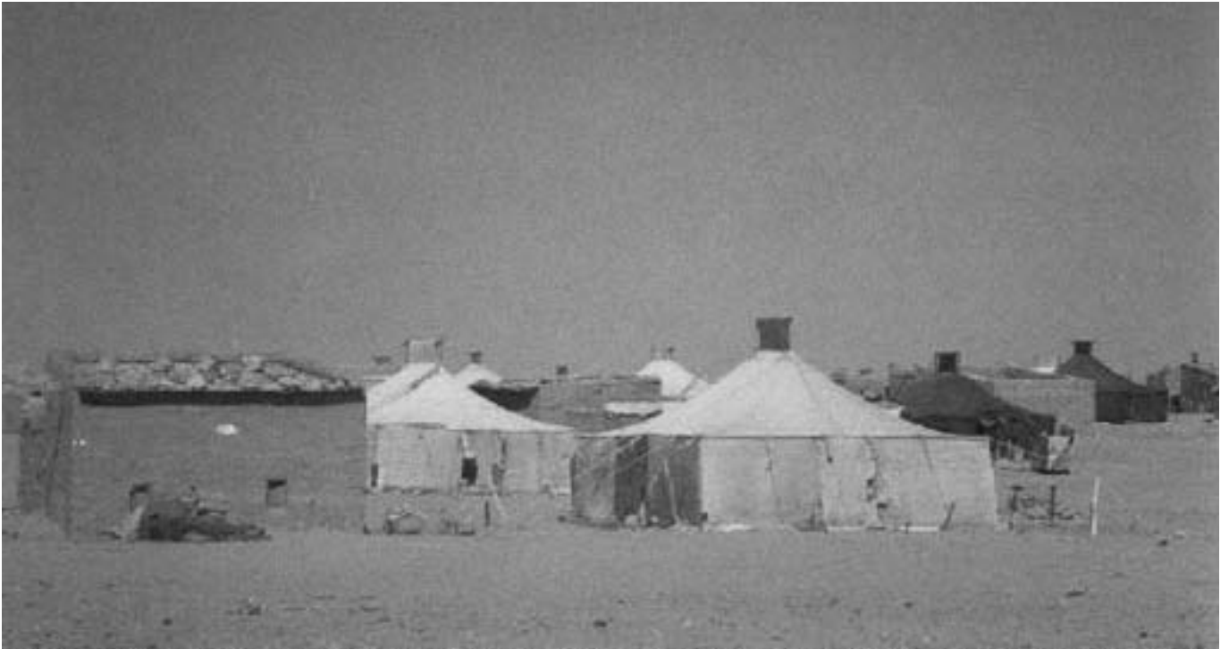
La precària atenció administrativa per part del govern marroquí cap el poble sahrauí empitjora la situació

que poguessin fer pensar en una sortida del conflicte.