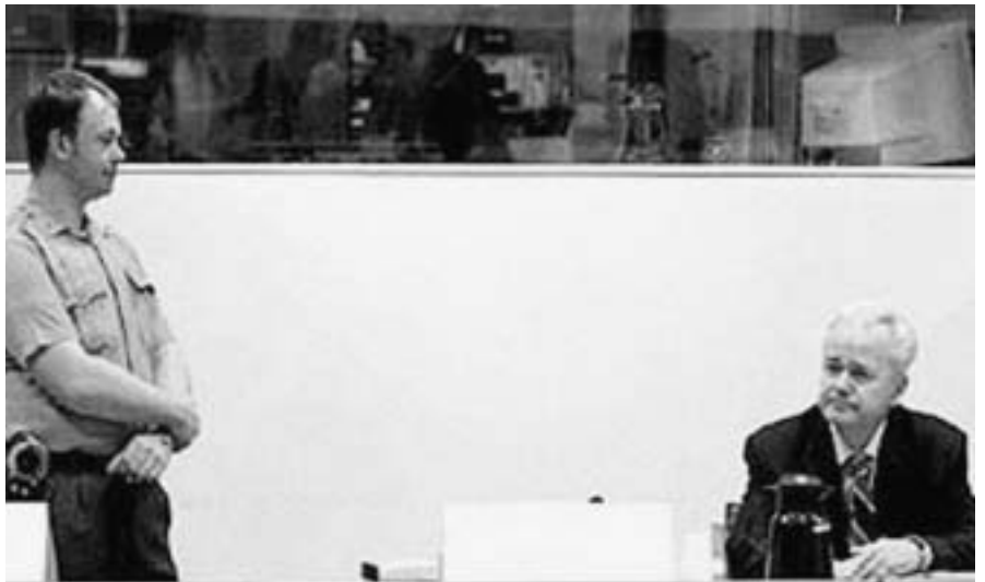
La impunitat d'un presumpte genocida pot dependre de l'acord de diversos estats

La competència de la CPI és jutjar individus més que estats, per responsabilitzar-los dels crims considerats més greus que afecten la comunitat internacional: crims de guerra, crims contra la humanitat i genocidi.