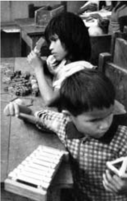
La situació d'aquest escolars es tradueix en un aprenentatge lent

hem cregut convenient realitzar cursos intensius de les matèries bàsiques. Tot i que amb 15 dies no es pot pretendre que els estudiants assoleixin el nivell adequat, hem considerat que podria ser una experiència molt enriquidora. Així mateix, creiem important que adquireixin una major consciència sobre la importància de l'educació i la reconeguin com a un dels drets fonamentals de l'individu.