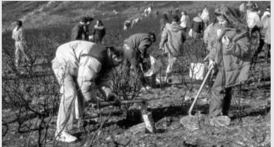
Les conseqüències mediambientals provocades per l'acció humana van sorgint

Los principales representantes de la ecología política de la pobreza están denunciando la aparición de un eco-colonialismo que actúa ahora de forma parecida como lo hizo el primer colonialismo histórico en el siglo XVI. Al igual que entonces (...) centra su discurso en las cosas que, siendo de todos, no son de nadie, de donde deduce que tales cosas han de ser patrimonio de la humanidad. El problema surge cuando este discurso implica, falazmente, que el control y la gestión de este patrimonio de la humanidad ha de recaer en quienes puedan utilizarlos convenientemente. Pues resulta que, de hecho, quienes pueden hacer un uso conveniente de los recursos ecológicos del planeta son los mismos que en otro momento histórico podían hacer un uso conveniente de las minas y tierras americanas, africanas o