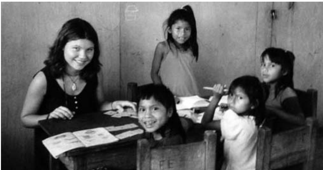
Els nens d'aquesta zona del Perú pateixen un sistema educatiu poc consolidat

El grup de joves de Sant Quirze Solidari ha realitzat, aquest estiu i per segon any consecutiu, un camp de treball a la comunitat de Progreso, situada a la selva amazònica del Perú. Allà, onze membres del grup hem conviscut durant dues setmanes amb els indígenes de l'ètnia chayahuita. El camp de treball s'ha centrat en la realització d'unes jornades educatives dirigides a infants, joves i adults d'aquesta comunitat i de les poblacions veïnes.