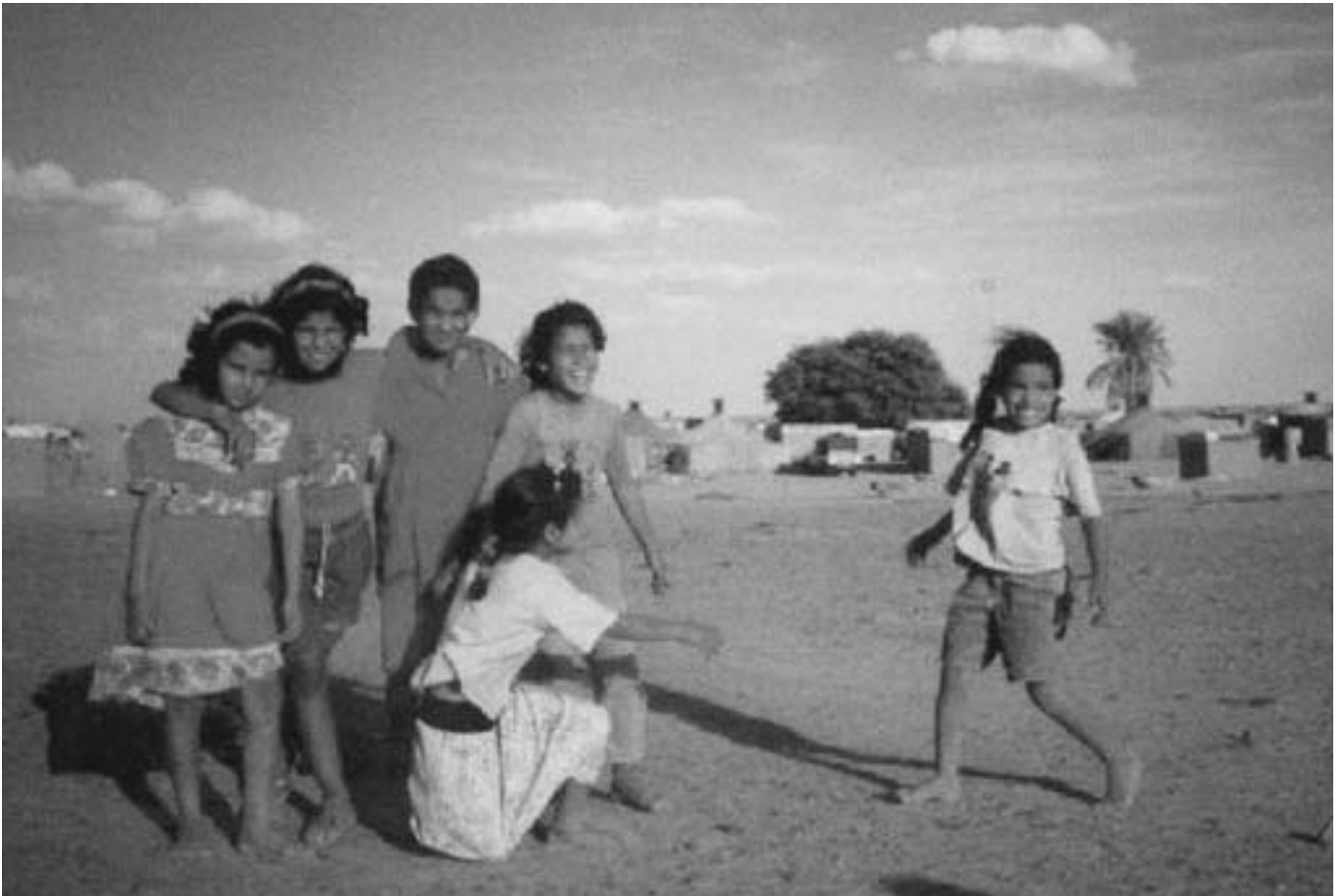
Els infants saharauís, com la resta del seu poble, veuen com altres països es disputen el seu present i futur

Són de tothom coneguts els orígens del conflicte del Sàhara: la responsabilitat del govern espanyol del Sr. Arias Navarro en la signatura de l'Acord Tripartit, en el qual es cedia l'administració del que havia estat la província espanyola del Sàhara als països veïns del Marroc i Mauritània.