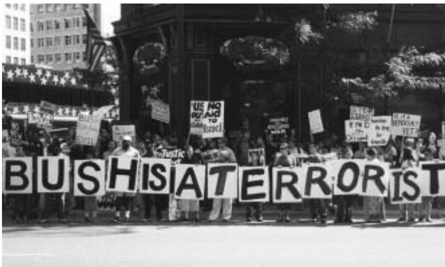
Incluso un sector de la patriótica sociedad americana se muestra en contra de la actuación de su gobierno y su país

Tanto relieve como lo anterior lo tiene el nulo respeto dispensado al derecho de guerra. Sin testigos,