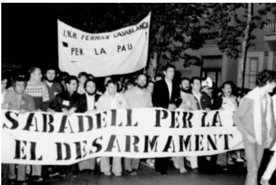
Durant anys s'ha participat en tota mena d'activitats

lunya i s'hi va aprovar i proclamar la Declaració universal dels drets dels pobles, que des de llavors ha estat com la nostra "carta magna". És una declaració naturalment revisable i reformable: ja llavors els catalans, entre altres, maldaven per veure-hi més explícits els drets de les minories nacionals i ètniques.