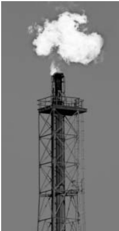
Otra vez, el petróleo parece ser un motivo de peso para atacar un pueblo

septiembre de 2001. Aunque los más ingenuos abrazaron la tesis de que semejante operación respondía al propósito de acabar con Al Qaeda, a la postre se ha abierto paso otra versión de los hechos que, con la riqueza energética de la cuenca del Caspio de por medio, refiere el deseo de extraer hacia el sur, a través de Afganistán, el petróleo y el gas correspondientes. Por si ello fuese poco, y volvamos a la geopolítica más rancia, Kabul ofrece una inestimable atalaya desde la que controlar los movimientos de Rusia, China, la India, Irak y Arabia Saudí.