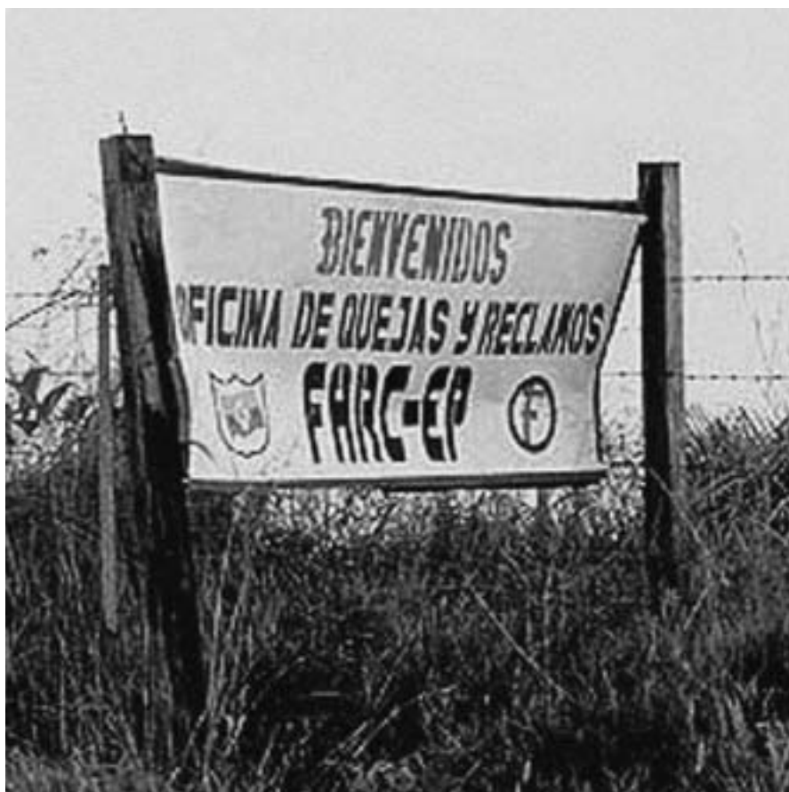
Las diferentes partes que participan en el conflicto están viviendo unos años de desconcierto mientras el pueblo intenta sobrevivir a la situación

La injusticias sociales, políticas y económicas, provocaron a mediados de los años 50 la aparición de las primeras guerrillas. Fueron una respuesta a las persecuciones oficiales contra el partido liberal en el campo. El gobierno expandía la agricultura capitalista y la consolidación del latifundio tradicional utilizando métodos tales como la muerte, o la tortura y la expulsión de los campesinos de sus tierras. La guerrilla surge, e intenta crear, una especie de administración de justicia donde la gente acude a resolver sus problemas en medio de ese enorme caos.