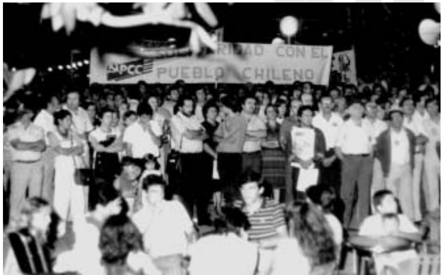
La solidaritat amb el poble de Xile, va ser, en els inicis, un dels eixos de treball més importants

Però, malgrat tot, en l'àmbit català i barceloní l'intent no va reeixir. Per més esforç que hi feren algunes persones, no s'aconseguí consolidar aquella incipient i prometedora Lliga Catalana. Seria llarg d'esbrinar-ne les causes. Ja és una pàgina de la nostra història.