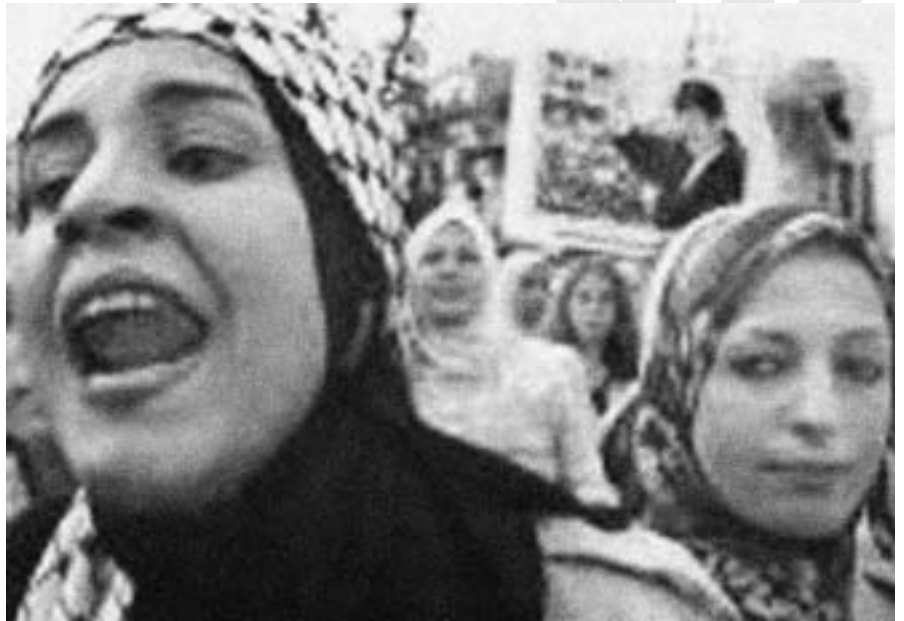
El pueblo iraquí sumará a la represión de su propio gobierno la desgracia de una guerra, sin apenas tener conocimiento real de las verdaderas causas

Afganistán no es, con todo, sino el primer paso de una guerra que en modo alguno se libra contra el terrorismo: se trata de una lucha sin cuartel contra las disidencias más dispares. A menos que algo se tuerza, el próximo hito de este singular y desequilibrado combate se