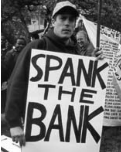
Existe una desaprobación general a las políticas del FMI y el Banco Mundial