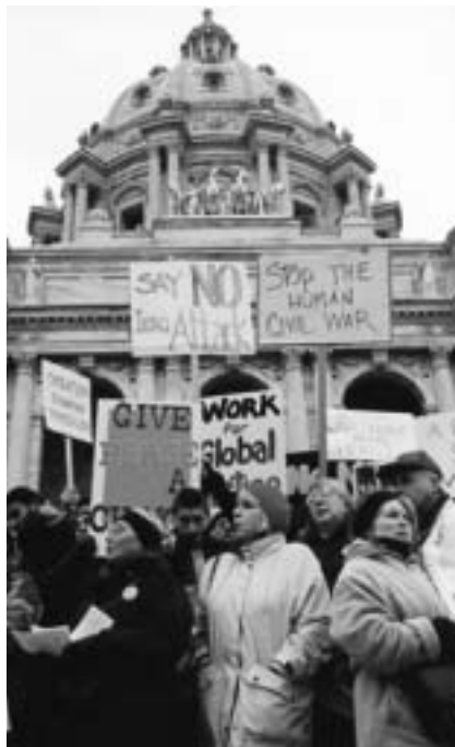
Los efectos del embargo impuesto a Irak ha dado un número escandaloso de víctimas civiles antes de que haya empezado el inminente conflicto bélico

Se diga lo que se diga, no parece mucho más halagüeño el panorama de la Unión Europea. La historia es bien conocida: cuando se intuye que las amenazas norteamericanas tardarán en concretarse, los dirigentes de la UE guardan, a menudo histriónicamente, las distancias; cuando el tiempo de las hazañas bélicas llega, las disidencias, en cambio, se evaporan. Eso sin contar, naturalmente, a quienes, como Aznar, Berlusconi y el consejero delegado de la British Petroleum, se ofrecen generosos sin que nada se les haya pedido. Aunque no sólo se trata de eso: siendo