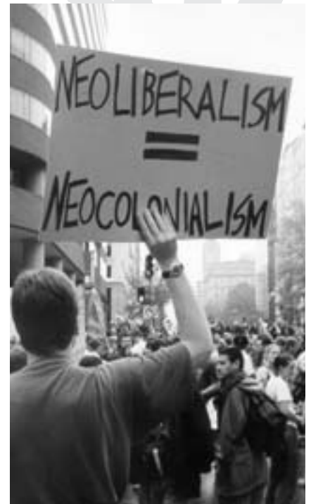
Para construir una alternativa sólida es importante definirla colectivamente

Sin embargo, para poder concretizarse, la utopía precisa de objetivos a mediano y corto plazo. Éstos se sitúan en los campos concretos de la acción colectiva: económica, política, ecológica, social, cultural... No entraremos en detalles en el marco de este trabajo. Esta precisión no puede evitar un doble principio ya expresado: un análisis de las relaciones sociales concretas y de sus efectos y un objetivo post-capitalista. En función de esto, muchas de las propuestas concretas serán similares a las regula-