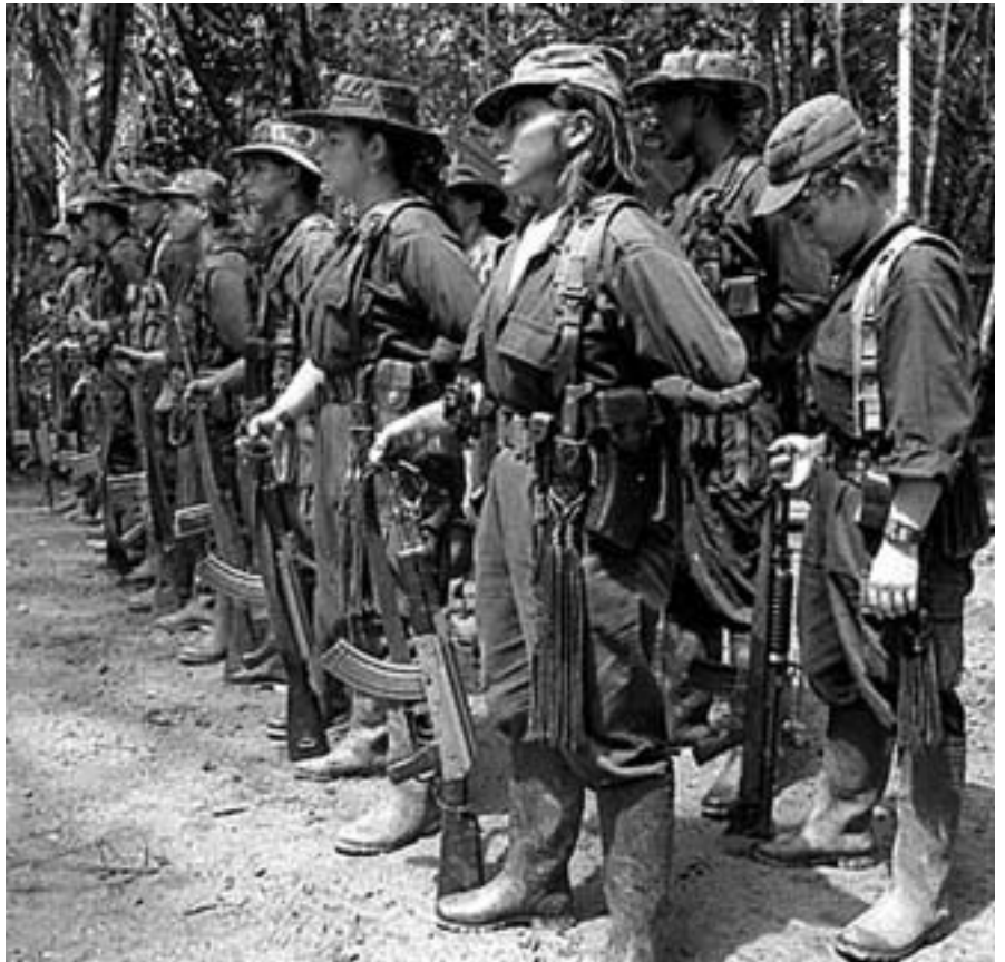
Las FARC conviven con otros grupos revolucionarios y paramilitares

Por departamentos, nos encontramos que en el departamento de Antioquia, existían unos 18 grupos, en Atlántico unos 7, en Boyaca unos 3, en el Cauca unos 14, en Cundina-