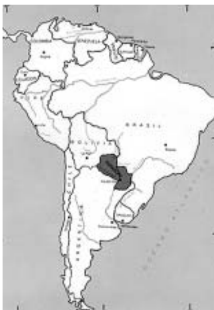
La seva situació geogràfica, entre Brasil, Argentina i Bolívia.