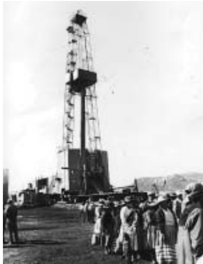
El tiempo nos da una visión más clara de como ha evolucionado el papel de los recursos energéticos desde los años setenta hasta nuestros días

Empezaba una nueva etapa, basada en la incontestable hegemonía política y militar de Estados Unidos, en la configuración de alianzas impensables hace unos años (Consejo OTAN-Rusia, mayo de 2002) y en la creciente importancia económica -y en menor medida, política- de la Unión Europea. Con el viejo orden internacional acababa también el siglo XX y la tarjeta de presentación del siglo XXI no pudo ser más brutal: el 11 de septiembre de 2001, los atentados contra las Torres Gemelas y contra el Pentágono ocasionaban más de 3.000 muertos y enfrentaban