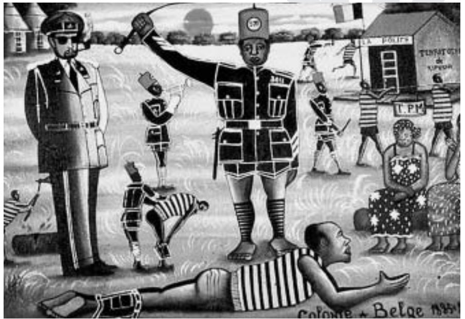
Des de la colonització per part dels europeus i el posterior procés d'independència, el Congo ha patit l'instabilitat social i política en tots els àmbits.

Aquest model d'esquema polític fa que la conflictivitat política actual s'hagi agreujat i aprofundit de manera dramàtica, i les divisions de pertinences ètniques obren un nou camp a la reflexió. De fet es tracta de saber, perquè tots els conflictes