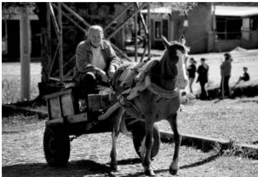
Els recursos que proporciona la terra dona esperances a un país malmès per la corrupció dels anteriors governs.

És un país de planures amb cerritos i cerros de com a molt vuit-cents metres d'alçada. Fa vint anys les planes estaven cobertes de bosc; ara quasi només en queda als espais protegits. Cada arbre és plata. I a Paraguai, la plata escasseja. Tot i així, la terra és agraïda i produeix soja, cotó, herba mate, canya de sucre, cereal, mandioca i pastura per a animals. Cada hivern és habitual cremar el sòl per fertilitzar-lo per a la collita següent, deixant extensions negres i columnes de fum a l'horitzó. A l'àrea rural, és el país amb més desigualtats de tot Sud-amèrica: des de propietats que no te les acabes amb la vista fins a parcel·letes sorroses amb què malviuen camperols humils. El país és majoritàriament agrícola i ramader, però té la central d'energia elèctrica més gran del món: la central d'Itaipú al riu Paranà, que comparteix amb el Brasil. L'escassa indústria restant es concentra als afores de grans ciutats com Asunción, la capital, i Ciudad del Este.