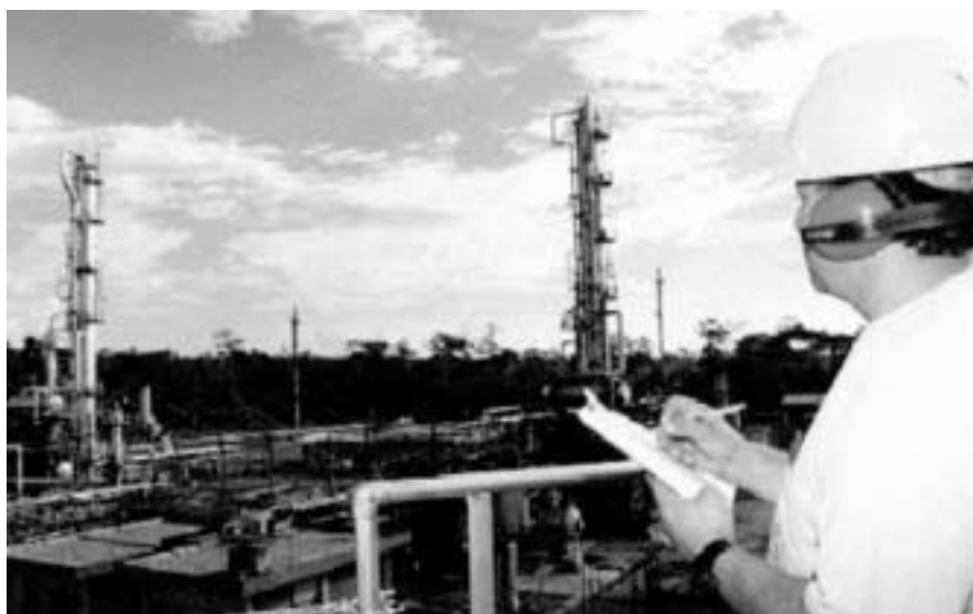
La extrema pobreza de algunas naciones contrasta con el valor de sus propios recursos, los cuales no pueden recuperar de manos de los países más desarrollados.

y la capacidad de destrucción militar. Sin duda, un caso evidente es Angola: uno de los países más pobres del mundo -en el año 2001, sobre un total de 174 países ocupaba el lugar 160 según el índice de Desarrollo Humano de las Naciones Unidas-, con más de un cuarto de siglo de guerra a sus espaldas, que ha provocado casi cuatro millones de desplazados -la cuarta parte de la población-, ha disminuido la esperanza de vida a 47 años y ha ocasionado que las dos terceras partes de la población haya de vivir con menos de un dólar al día y, sin embargo, con importantes yacimientos de petróleo y minas de diamantes. En definitiva, en el centro de la nueva conflictividad internacional se sitúa la disputa por el control de los recursos -como ya había sucedido durante el período colonial- y, sobre todo, del petróleo y el gas que son los combustibles que mueven el motor de la economía mundial.