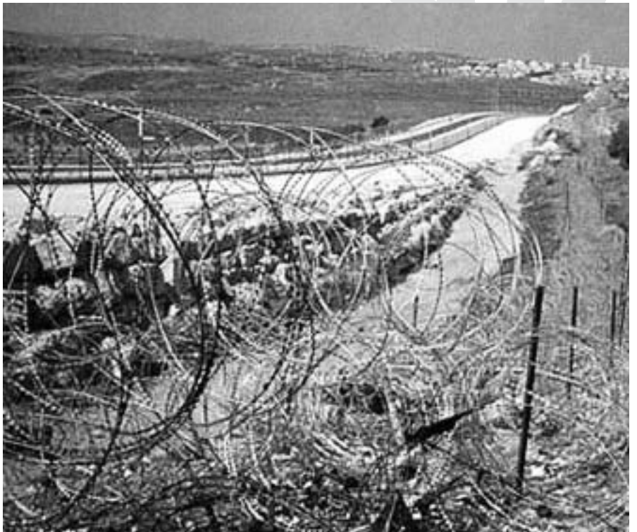
L'aïllament de la població palestina mitjançant el mur complicarà encara més la situació a la franja de Gaza i Cisjordània.

L'objectiu de Sharon va fins i tot més enllà. L'actual govern d'Israel vol continuar l'ocupació i colonitzar el màxim de territori, pressionant els països que donen suport als palestins fins que hagin d'abandonar la política de solidaritat i derrotant la resistència palestina. El Likud i els partits de la dreta creuen que ho podran aconseguir amb l'ajuda dels Estats Units a l'Orient Mitjà, i als territoris ocupats debilitant la pobla-