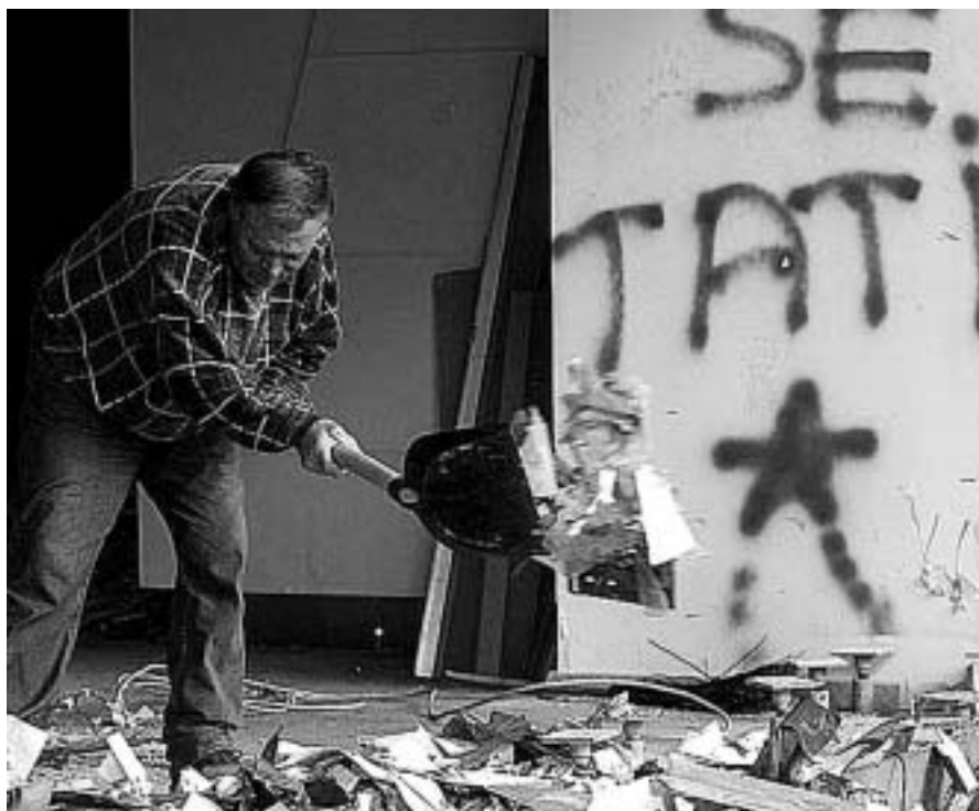
A los ciudadanos serbios les queda mucho trabajo antes de poder disfrutar de un panorama político estable

mafiosos cuyos cimientos han permanecido intactos desde la era de Milosevic. El resultado de tal acumulación de desafueros no es otro que el estruendoso descrédito de políticas neoliberales que, aquí como en tantos otros escenarios, se han saldado con un inquietante engrosamiento de las bolsas de pobreza.