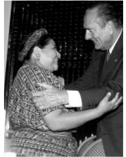
Menchú ha estat clau en la difusió internacional de la crisi Guatemalteca

24-25 de juliol: grups de camperols de les patrulles d'autodefensa civil i membres del Front Republicà Guatemalenc (partit de Ríos Montt i del president Portillo) organitzats militarment ocupen llocs estratègics de Ciutat de Guatemala. Assalten la Cort Suprema de Justícia, la Cort Constitucional i el Tribunal Suprem Electoral. Assassinen un periodista i generen un clima de terror en la po-