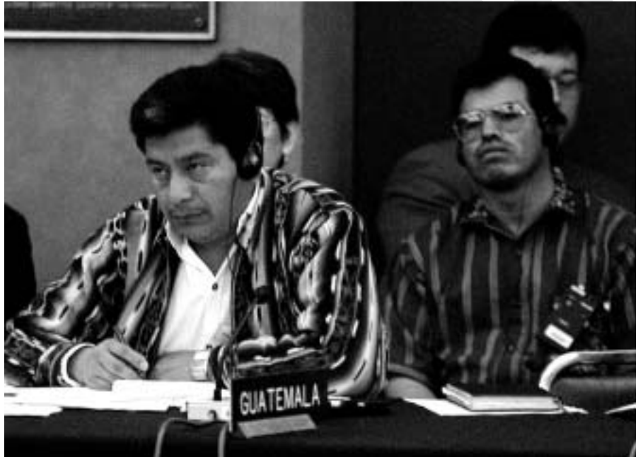
Pedro Ixchop és el líder dels indígenes de Guatemala, els quals han estat sistemàticament marginats i aniquilats durant el conflicte entre la guerrilla i l'exèrcit.

La nova administració que s'ha instal·lat al poder el 14 de gener d'enguany tindrà el gran repte d'aconse-