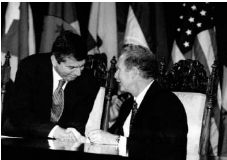
Álvaro Arzú, líder del Partit d'Avançada Nacional, va ser elegit president de Guatemala l'any 1996

1998 - 24 d'abril: el bisbe auxiliar de Guatemala, Juan Gerardi Conejera, director de la pastoral, creador del Projecte de recuperació de la memòria històrica i responsable de l'Oficina de Drets Humans de l'arquebisbat de Guatemala, presenta el Informe Guatemala nunca más: informe proyecto interdiocesano de recuperación de la memoria histórica . En aquest informe queda clar que l'exèrcit de Guatemala i els paramilitars van ser els responsables del 93% de les violacions dels drets humans documentades a l'informe, comeses durant els 36 anys de guerra.