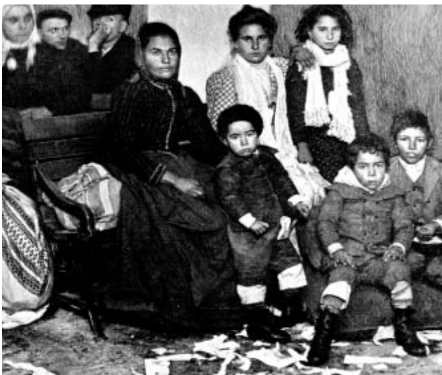
Una ciudad sólo puede reconocerse culturalmente com el fruto de herencias, tránsitos y presencias sucesivas

Mantener conductas culturales singularizadas ha sido esencial, por otro lado, para que los inmigrantes lograran enfrentarse a los cuadros de explotación y marginación. Los mecanismos de reconocimiento mutuo entre los inmigrantes de una misma procedencia siempre les ha dado la posibilidad de activar una red de ayuda mutua y de solidaridad muy útil. La transferencia de costumbres públicas (fiestas religiosas o laicas, reuniones periódicas, etc.) o privadas (desde los cuentos que los adultos cuentan a los niños