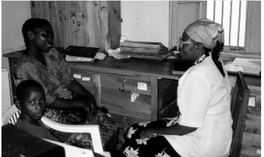
La SIDA ataca més durament allà on hi ha menys mitjans per prevenir-la i tractar-la. La infància és el sector més vulnerable.

És important reivindicar, doncs, la legalització de patents simultànies per a diversos països (el govern dels Estats Units, que com sempre tira pel dret, intenta signar acords bilaterals per a la fabricació de genèrics amb un únic país i rebutja fer-ho simultàniament amb diversos països).