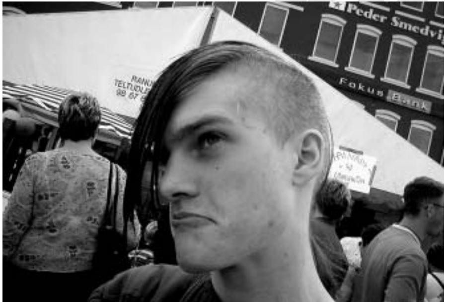
La actitud de las personas de diferenciarse del resto, individualmente o en grupo, crea minorías culturales sin la necesidad de potenciar sus raíces étnicas.

Frente a este uso metafísico de la noción de cultura, la mayoría de antropólogos adoptan otra interpretación: la cultura como el conglomerado de tecnologías materiales o simbólicas, originales o prestadas, que pueden integrar un grupo humano en un momento determinado. Por mucho que encontremos expresiones culturales rudimentarias entre algunos mamíferos, podría considerarse como todo aquello que puede ser socialmente adquirido. Podría definirse la cultura entonces como un sistema de códigos que permite a los humanos relacionarse entre sí y con el mundo. En todo caso cultura debe ser considerado como sinónimo de manera, estilo... de hacer, de actuar, de decir, etc. Por consiguiente, hablar de diversidad cultural sería una redundancia, puesto que la diferenciación es para los humanos siempre una función de la cultura. Así, serían culturales las diferencias conductuales, comportamentales, lingüísticas e intelectuales, así como otras que pudieran antojarse meramente físicas y naturales, en la medida en que se las considere como culturalmente sig-