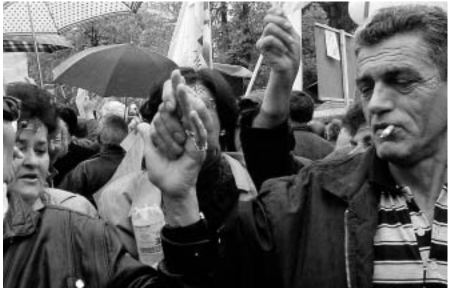
La desaparición de Milosevic de la escena política serbia no ha significado la extinción de los problemas ya que, para muchos, es solo un exlíder corrupto.

Lo primero que esa consulta electoral revela es el reclamo que, a los ojos de parte de la ciudadanía, corresponde a un discurso que, agresivo y victimista, se muestra poco proclive a aceptar responsabilidades propias en la desintegración violenta de Yugoslavia y asume de buen grado la conveniencia de mantener a raya -antes en virtud de la baladronada que de la amenaza creíble- a vecinos y potencias foráneas. Significativo es al respecto, por cierto, que sean muchos los serbios que, tras identificar en el ex presidente Milosevic a un dirigente corrupto e inmoral, se muestran remisos a atribuirle papel alguno en sucesivos crímenes de guerra, no precisamente menores, en Croacia, Bosnia y Kosovo. Como significativo se antoja que el Partido Radical de Seselj -una fuerza de corte parafascista que ha experimentado, dicen, un lavado de imagen que bebe, acaso, en la ausencia de guerras que librar- haya crecido electoralmente mientras remitía el respaldo popular a las listas del Partido Socialista que lideraba el propio Milosevic. Y es que el desmoronamiento de las