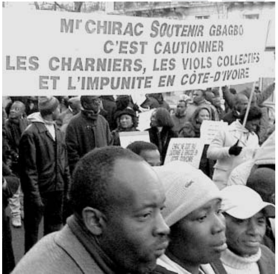
Les mobilitzacions populars a Costa d'Ivori han estat durament reprimides pel govern provocant diverses morts

Amb tot plegat, L. Gbagbo ha optat per un discurs nacionalista, per tal de crear una oposició contra els interessos francesos; però també de Burkina Fasso o Libèria que pretenen desestabilitzar la zona per inte-