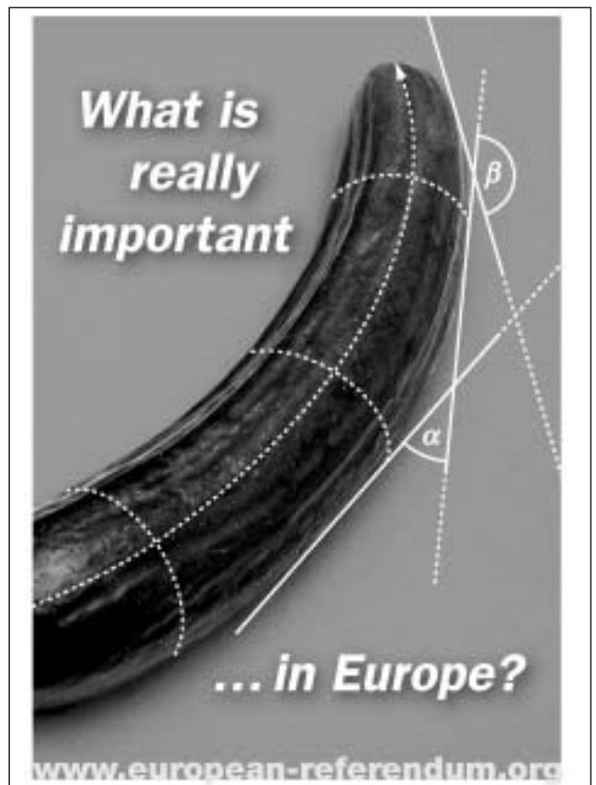
Un parell d'exemples de les reaccions en contra de la constitució europea.

per tant els comentaris que faré a continuació necessàriament seran de caràcter general. Primer que res, cal ressaltar el caràcter continuista de la Constitució en relació amb l'actual Tractat de la Unió Europea. La Constitució no comporta canvis radicals ni en el funcionament ni en les polítiques de la Unió Europea. Es tracta, més aviat, de reformes que pretenen clarificar, simplificar i introduir algunes millores tècniques en l'actual sistema. Així, per exemple, una de les qüestions que més positivament es valora és la inclusió en el text del Tractat constitucional de la Carta de drets fonamentals.