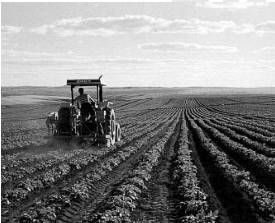
L'actual política agrària, segueix afavorint les multinacionals, en detriment de les economies locals

La política econòmica del model en curs pren la direcció oposada. Si no canviem la política econòmica, si no discutim un nou model, no hi haurà espai per a la Reforma Agrària. Estaran sepultades les esperances d'assentar-se al camp i de recuperar la seva ciutadania de milions de famílies. Continuarem lluitant, complint la missió d'organitzar els pobres del camp perquè lluitin pels seus drets, pel canvi de la política econòmica i per la Reforma Agrària. Esperem que, passades les eleccions municipals, el govern tingui el coratge de reprendre el debat sobre el model econòmic i que segueixi el camí de la construcció d'un projecte popular pel Brasil. De la nostra part, afirmem que continuarem fermes en el camí de les lluites socials, perquè ningú mereix i suporta viure sota una lona negra (la lona preta amb que es construeixen els acampaments)