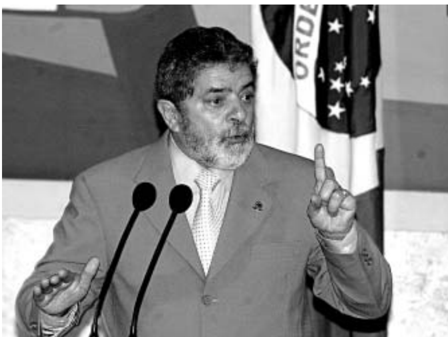
Les dimensions de la situació dels sense terra no han trobat una ràpida resposta de Lula, tot i les promeses inicials

per molt temps, il·lusionat tant sols per promeses que no omplen l'estómac. Els treballadors i les treballadores rurals necessiten accions concretes i urgents per part dels governants. I ja. Una forta abraçada per a tots i totes!