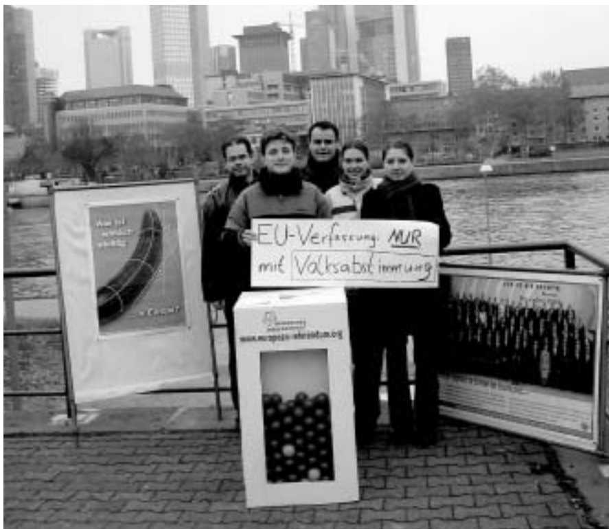
Aquest grup reclama una sobirania real del poble europeu a l'hora de prendre les decisions que afectaran a milions de persones.

tants del estats. Per tant, malgrat que l'article 1 del document declari que "la Constitució neix de la voluntat dels ciutadans i dels estats d'Europa de construir un futur comú", la realitat és que només els estats continuen sent "els senyors" del text. No existeix un subjecte europeu que es configuri com autèntic poder constituent democràtic.