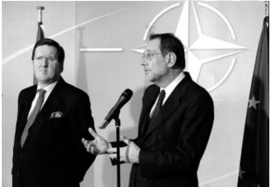
La política de l'OTAN condiciona les decisions a Europa. A la foto, el secretari general de l'OTAN, el nord-americà Lord Robertson i el representant de la UE, Javier Solana.

L'exemple potser més clar el constitueix la Política exterior. Sorprenentment sovint l'afirmació de que aquesta Constitució és necessària per reforçar Europa enfront de les