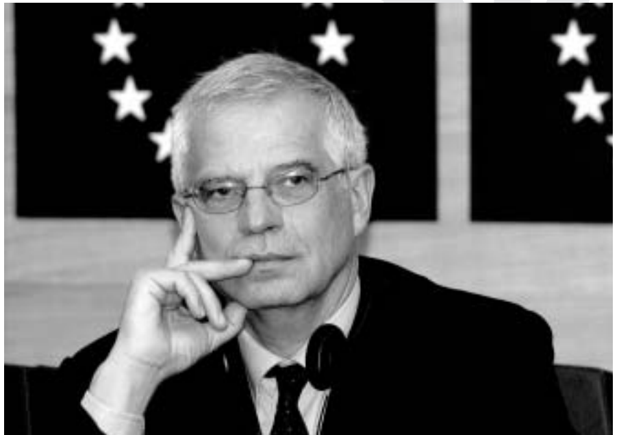
Josep Borrell és l'actual president del Parlament Europeu

En segon lloc, els mètodes de treball que s'han utilitzat són molt discutibles des d'un punt de vista democràtic. S'ha optat per un mètode anomenat deliberatiu, que ha suposat en la pràctica un paper decisiu del Praesidium. No s'ha votat mai i ha estat el Praesidium qui ha elaborat el text definitiu recollint el sentit de la majoria, a partir dels debats i les esmenes presentades. Per posar només un exemple: la proposta franco-alemana de crear un president estable pel Consell Europeu va ser defensada pels estats grans, i en la discussió plenària d'un total de poc més de 90 intervencions, més de 60 es van pronunciar en contra. Per escrit es van presentar 80 esmenes.