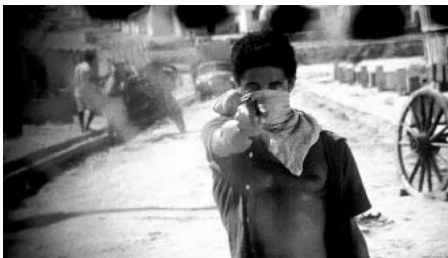
Cidade de Deus, basada en la novel·la de Paolo Lins, és una reflexió sobre l'extrema pobresa, i la violència que viuen els nens sense infantesa

gro) escriu cartes a persones analfabetes, per tal de completar la minsa pensió de mestra jubilada. Un cop a casa decideix quines envia i quines quedaran tancades en un calaix. Un dia arriben una dona i el seu fill de nou anys Josué. Quan la dona mor atropellada, Dora es fa càrrec del nen. Penedida d'haver-lo lliurat a una llar d'adopció en un primer moment, l'acompanyarà a la recerca del pare en un llarg viatge, que li oferirà a ella la possibilitat de recuperar la tendresa perduda.