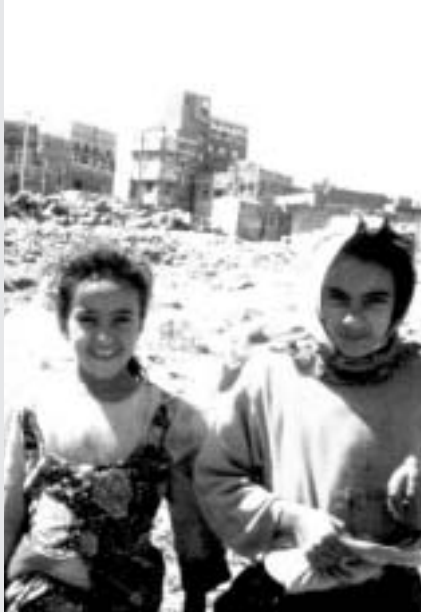
El gobierno en Yemen, no ha hecho nada para acabar con el tráfico de niños.