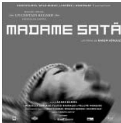
Madame Satã és una mirada a la societat brasilenya més marginal, i també una història èpica sobre com l'art pot provocar canvis en els prejudicis del públic

Per últim, el tercer tall ens porta a l'any 1989. Buscapé realitza els somnis de la seva infància, quan aconseguix una càmera i pot fotografiar el món de la favela, vedat per a tots els que no hi pertanyen. Dadinho, per la seva part, s'ha convertit en el narcotraficant més temut i respectat de