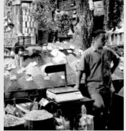
Ningún otro país consintió sacrificar tantos aspectos de su cultura para afirmar su identidad europea.

Otros recurren a la historia. (...) Sucesor del Imperio Bizantino, el Imperio Otomano tuvo de hecho la ambición de dominar el Mediterráneo y Europa (proyecto varias veces quebrado, particularmente en Lepanto en 1521). Esta ambición no convierte a Turquía en una especie de “anti-Europa”. Otros Estados -España, Francia, Alemania- también acari-