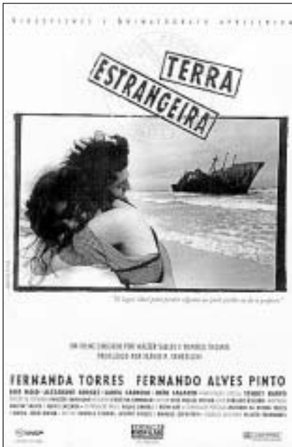
Terra Estrangeira narra les migracions forçoses causades per la pobresa

grafia un mitjà per salvar-se en el món violent de la favela.