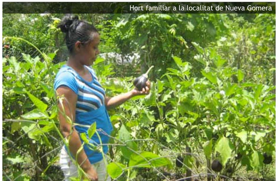
Hort familiar a la localitat de Nueva Gomera

Una altra comunitat que vam visitar, Nueva Gomera, es dedica exclusivament, o majoritàriament, al conreu de canya de sucre. Guatemala és el quart exportador de sucre del món, i aquests ingenios , com anomenen allà els grans latifundis, fumiguen els camps per aire amb productes, com ara el glifosat, un herbicida prohibit en molts països arran d’estudis que demostren que és cancerigen. A Nueva Gomera, envoltada d’aquests cultius de canya de sucre, denunciem contínuament el perill del llançament d’aquestes fumigacions per sobre de les seves cases, com vaig poder observar. “L’alvocat no arriba a madurar, el mango cau de l’arbre durant el procés de maduració, ja no comptem amb els nostres petits