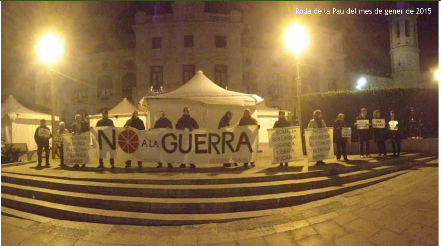
Roda de la Pau del mes de gener de 2015