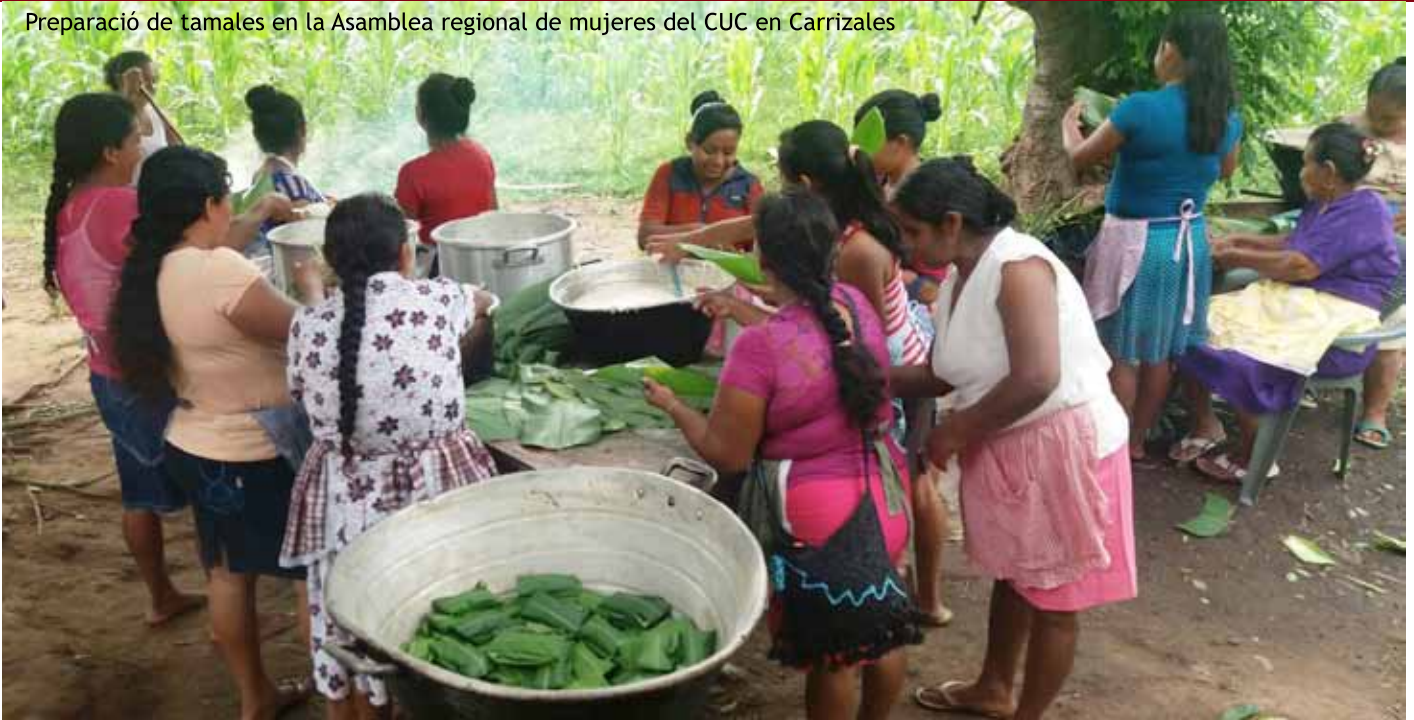
Preparació de tamales en la Asamblea regional de mujeres del CUC en Carrizales