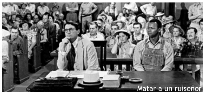
Matar a un ruiseñor

(John Ford, 1960) ja apuntava com d'arrelada estava aquesta cultura, fins i tot entre els anomenats progressistes, com també mostrava l'excel·lent Matar a un ruiseñor (Robert Mulligan, 1962) una