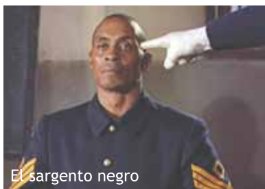
El sargento negro

Una obra atípica per l'època com El sargento negro