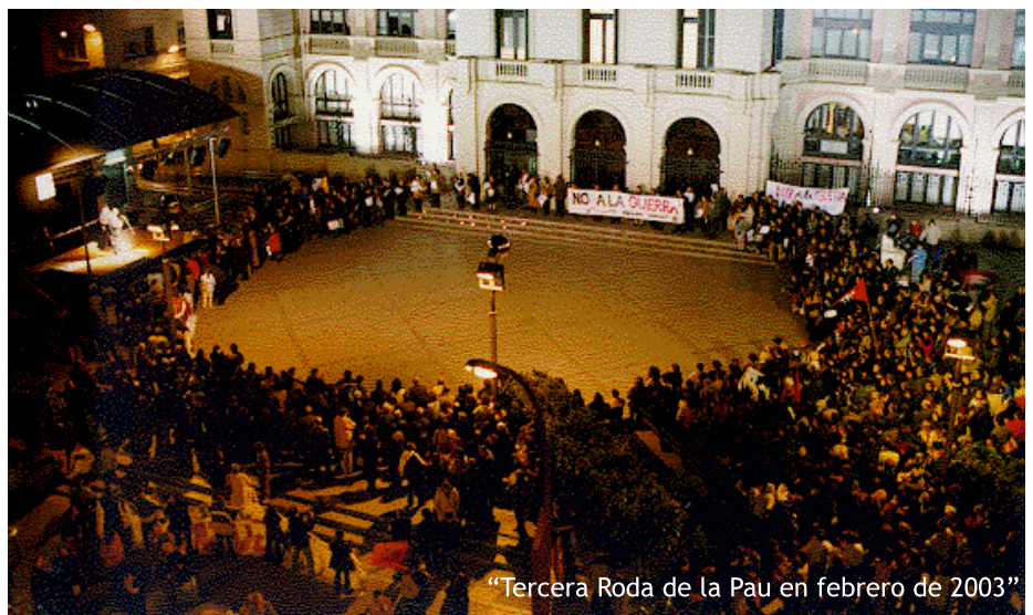
“Tercera Roda de la Pau en febrero de 2003”

No ens cansarem mai de reivindicar LA PAU!