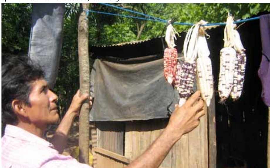
Agricultor amb el maíz criollo que estan recuperant a la zona de Campo Libre