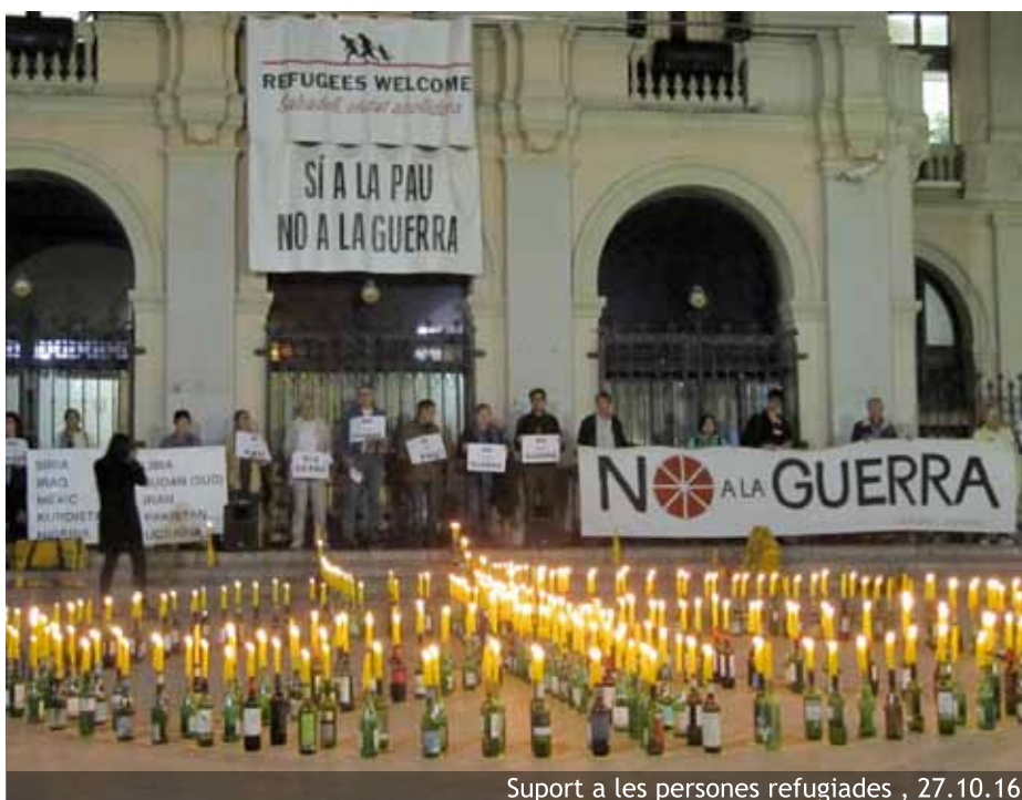
Suport a les persones refugiades , 27.10.16

La mateixa guerra d'Iraq que ens va esperonar a organitzar-nos ha seguit sent, i segueix sent encara, un conflicte de mai acabar. La sang continua banyant els carrers de l'Iraq, l'Afganistan i el Pakistan. La guerra a Síria, l'aparició de l'ISIS, que afecta a Síria, l'Iraq i el poble kurd, així