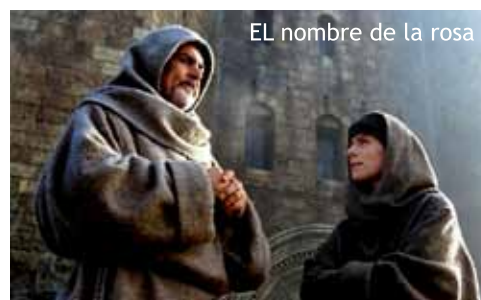
EL nombre de la rosa

També Umberto Eco va mostrar les ombres de la religió a la seva gran obra medieval, El nombre de la rosa , excel·lentment