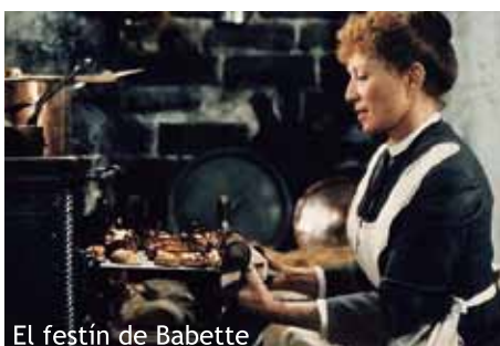
El festin de Babette

El film narra amb tots els detalls les contradiccions dels processos inquisitorials i com els defensors de la puresa de Déu i la moral s'acaben convertint en encarnacions del mal i sàdics incitadors de l'odi i la tortura. Una dicotomia que, salvant les distàncies i sense contenir tints religiosos, mostrava Lars Von Trier (també danès) precisament seixanta anys després, al 2003, amb l'excel·lent Dogville .