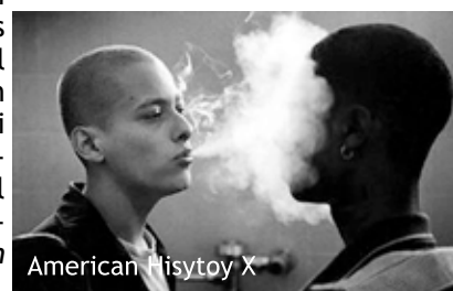
American History X