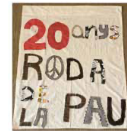
20è ANIVERSARI DE LA RODA DE LA PAU DE SABADELL

activitat formava part de la commemoració del Dia Escolar de la No-violència i la Pau (DENIP).