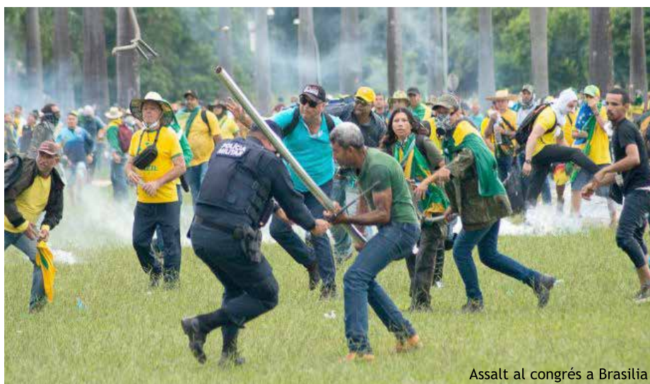
Assalt al congrés a Brasília

A Europa, en ple conflicte bèl·lic propiciat per una potència autoritària nostàlgica del seu passat imperial, s'expandeixen amb més o menys força les opcions polítiques populistes i s'incrementa la polarització política i social. De Polònia a Itàlia, de la Gran Bretanya post-Brexit a Hongria, veiem consolidar-se discursos i governs que fonamenten la seva política en els posicionaments populistes, il·liberals i propers a l'autoritarisme. També en els països assentats sobre posicions polítiques moderades, a dreta i esquerra, com França, Alemanya, o Espanya, o fins i tot en els països poc estables països nòrdics, han anat creixent les opcions polítiques nacionalpopulistes. El Reagrupament Nacional de Le Pen, la França Insubmissa de Melançon, Alternativa per Alemanya, Llei i Justícia a Polònia, el Fidesz d'Orbán a Hongria, la Lliga de Salvini o els Germans d'Itàlia de Meloni, Vox a Espanya, o les diverses