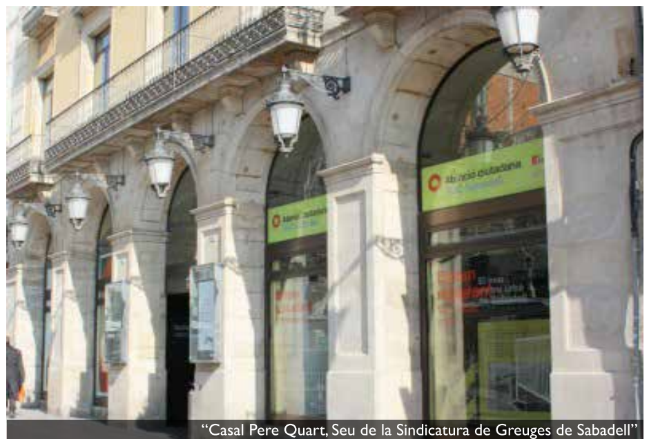
“Casal Pere Quart, Seu de la Sindicatura de Greuges de Sabadell”

A mi, com diu el Síndic de Barcelona, no m'agrada parlar de persones vulnerables, sinó de persones vulnerabilitzades. Però encara m'agrada més un concepte que fa servir la presidenta de la Comissió de Drets Humans de Mèxic, que també forma part de la junta d'AGOL, quan parla de persones d'atenció prioritària, que és un concepte que posa el focus en qui ha de fer la feina. A Sabadell, com a la resta de Catalunya, tenim moltes persones d'atenció prioritària, tant pel que fa a persones que malviuen en habitatges insalubres o que no tenen els mínims de connexió elèctrica, calefacció o persones que viuen al carrer, que és un tema sobre el qual fa molt temps que insisteixo que s'ha de fer alguna cosa. A Catalunya tenim la llei de sensellarisme que ha permès dotar de més recursos els municipis per afrontar aquest