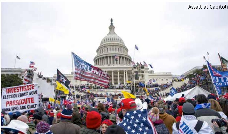
Assalt al Capitoli