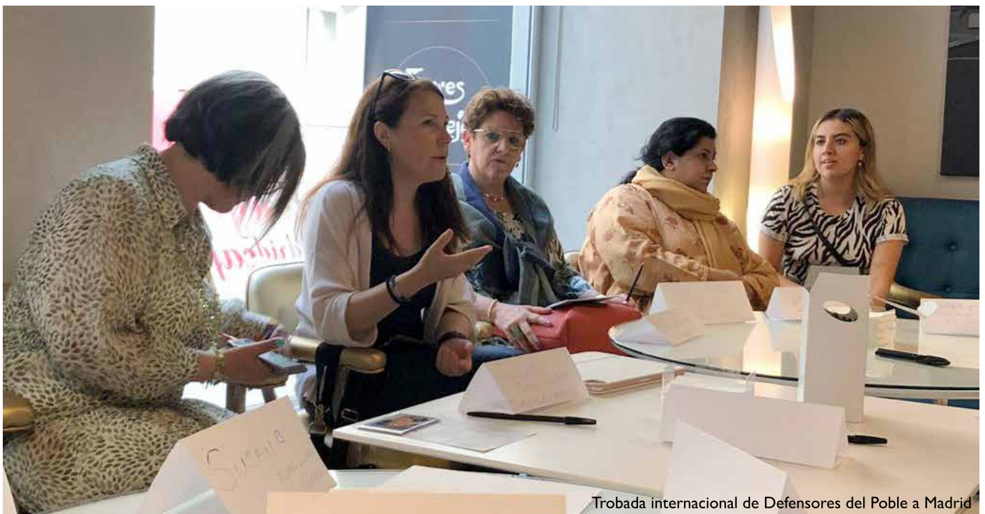
Trobada internacional de Defensores del Poble a Madrid