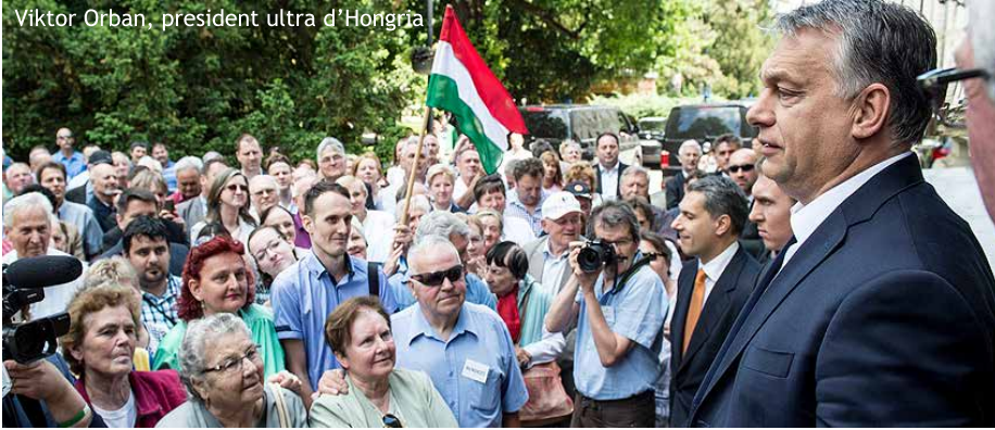
Viktor Orban, president ultra d'Hongria

forces d'extrema dreta i ultranacionalistes en els països nòrdics, s'orienten amb més o menys contundència cap a posicions de "xovinisme econòmic i social" (el benestar i les ajudes només per als nadius), de populisme nacionalista o de nacionalconservadurisme, i d'entorpiriment i boicot en l'avenç de la construcció política d'una Europa més forta, unida i de vocació federal.