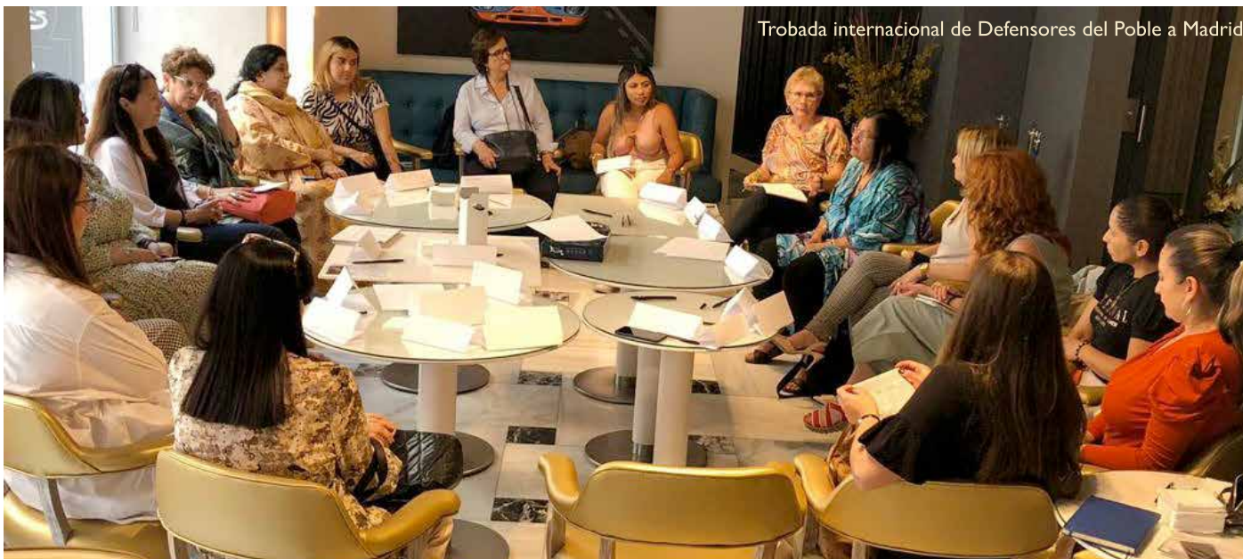
Trobada internacional de Defensores del Poble a Madrid

problema. Però Sabadell, una de les mancances que té és un alberg o un espai de baixa exigència per acollir aquestes persones. Perquè el problema més gran, a la base de molts altres, és l'accés a un habitatge digne.