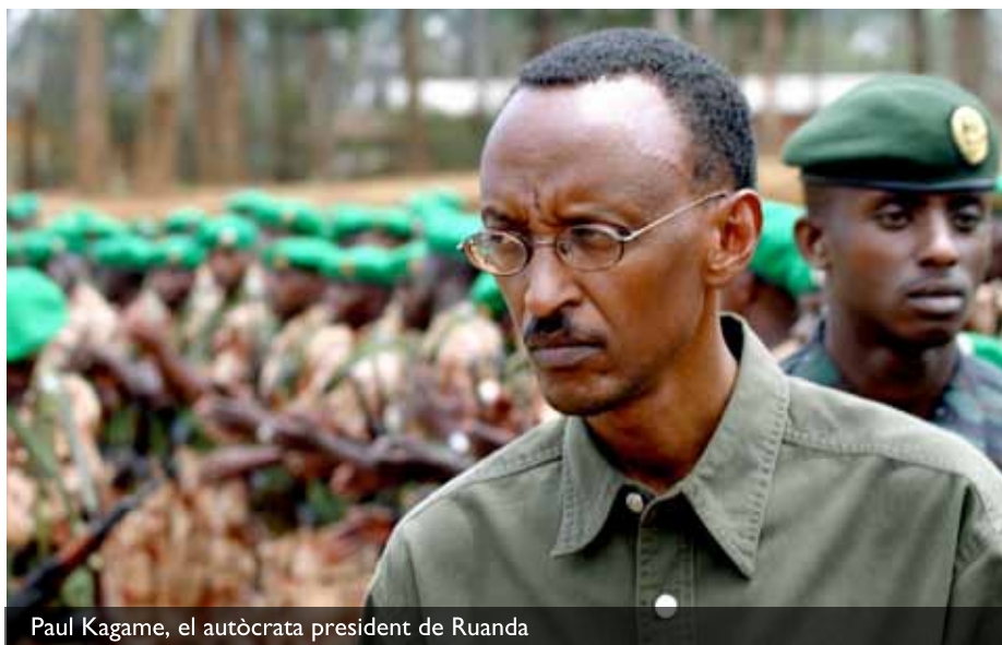
Paul Kagame, el autòcrata president de Ruanda

En aquests 25 anys els casos de polítics que han acabat a la presó són nombrosos, com han denunciat en el seu moment Amnistia Internacional i Human Rights Watch (HRW). Els periodistes no