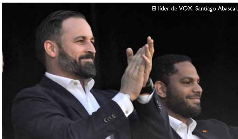
El líder de VOX, Santiago Abascal.

A les municipals, i de retruc a les europees, va treure molts menys vots que a les generals per la manca de cultura democràtica del pinyol de Santiago Abascal en la gestió del partit. A molts llocs de l'Estat, també a Catalunya, es van imposar des de l'executiva caps de llista aliens als grups locals que ja tenia Vox -aquí va passar amb gent de Plataforma per Catalunya-, cosa que va generar conflictes arreu. I l'executiva també va impedir als