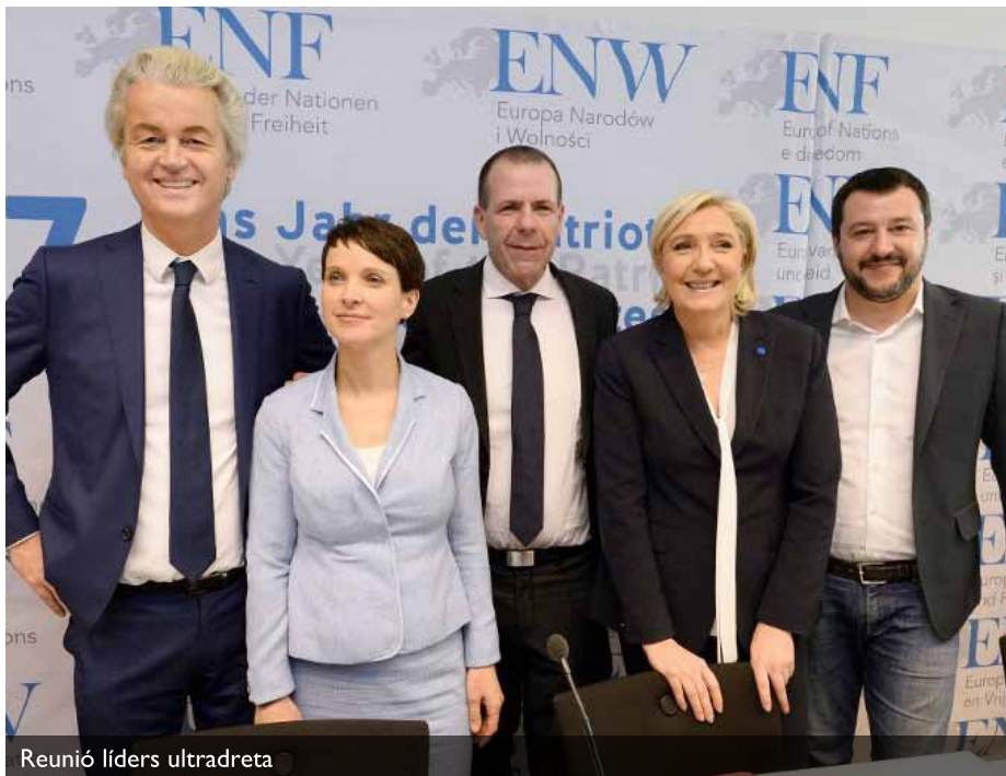
Reunió líders ultradreta

França ha guanyat el Reagrupament Nacional de Marine Le Pen, amb el 23,31% i 22 escons. Le Pen filla ha completat aquest últim mandat el trencament amb el seu pare, Jean Marie Le Pen, i el fins fa unes setmanes també eurodiputat del Front Nacional, Bruno Gollnisch, negacionista de l'Holocaust, que manté, com el vell Le Pen, la ideologia ara antisemita. I és que avui bona part de la ultradreta europea -també Vox- no només rebutja l'antisemitisme, sinó que considera Israel com un amic i aliat que és el baluard i trinxera d'Occident enfront de l'amenaça islamista.