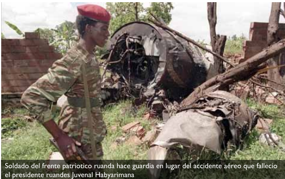
Soldado del frente patriótico ruanda hace guardia en lugar del accidente aéreo que falleció el presidente ruandes Juvénal Habyarimana

estan millor. En la Classificació Mundial del 2019 de Reporters sense Fronteres (RSF), Ruanda ocupa el lloc 155 de 180. Per darrere, a l'Àfrica només es troben Burundi (159), Somàlia (164), Guinea Equatorial (165), Sudan (175) i Eritrea (178). El primer país africà de la llista és Namíbia (23), seguit de Cap Verd (25). Segons RSF, en els darrers 20 anys han estat assassinats 8 periodistes i 35 han estat obligats a exiliar-se.