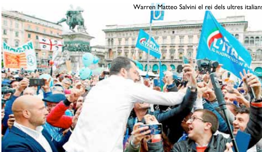
Matteo Salvini el rei dels ultreres italians.

La ultradreta ha estat la força més votada a cinc estats de la Unió. A