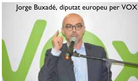
Jorge Buxadé, diputat europeu per VOX

A les eleccions del 28 d'abril, Vox va irrompre amb 24 diputats i 2.677.173 vots. A les europees del 26 de maig va baixar, amb 1.388.681 vots i 3 eurodiputats. A les municipals va aconseguir 530 regidors arreu de l'Estat, dels quals només tres a Catalunya, tots al municipi de Salt.