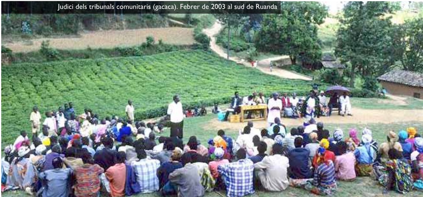
Judici dels tribunals comunitaris (gacaca). Febrer de 2003 al sud de Ruanda