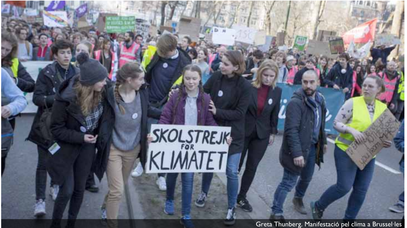
Greta Thunberg. Manifestació pel clima a Brussel·les

Any 1972. Reunió anual de l'American Association for the Advancement of Science en el MIT. El matemàtic i meteoròleg Edward Norton Lorenz (1917-2008) pregunta a l'audiència: «pot l'aleteig d'una papallona al Brasil produir un tornado a Texas?».