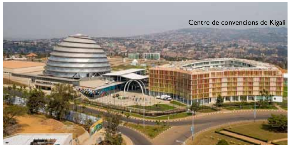
Centre de convencions de Kigali

El nou règim va deixar clar des de bon principi que faria justícia, qualificada com "justícia dels vencedors" per part de l'acadèmic Mahmood Mamdani. Desmantellat el sistema judicial per la fugida dels magistrats, principalment hutus, els primers judicis van haver d'esperar, mentre s'amuntegaven desenes de milers de presos, la majoria mantinguts a la garjola sense una acusació formal. Es van arribar a aplicar penes de mort als primers condemnats pel genocidi, una pena màxima abolida posteriorment pel Parlament. Les darreres execucions es van registrar el 1998. Per accelerar els processos, es va recórrer als tribunals tradicionals gacaca, que fins i tot en l'època colonial dirimien en la comunitat petits delictes, com el robatori de bestiar. Pels gacaca -n'hi havia un miler per tot el país-, van fer desfilar en audiència pública els acusats, jutjats per uns membres del tribunal que havien estat elegits per sufragi universal. Al mateix temps, a Arusha (Tanzània), el Tribunal Penal Internacional per a Ruanda (TPIR), creat per les Nacions Unides, jutjava els alts càrrecs hutus i inductors del genocidi, entre els quals des-