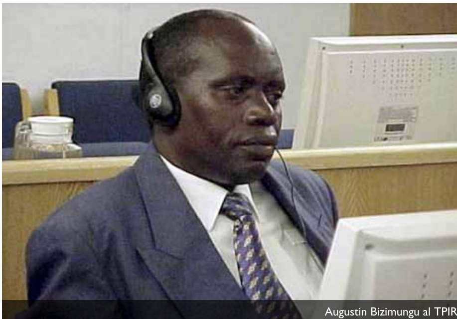
Augustin Bizimungu al TPIR

taaven persones vinculades a la Ràdio Televisió Lliure de les Mil Colines (RTL), el principal mitjà de l'odi.