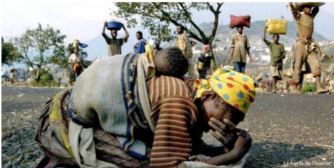
La fugida de l'horror

Una intervenció al Congo que ha estat una constant des del canvi de règim a Kigali. L'operació Turquesa, encapçalada per França, havia permès que desenes de milers d'hutus s'arreglessin als camps de refugiats, sobretot als voltants de la ciutat de Goma. Però també havien passat la frontera bona part dels membres del derrotat Govern hutu i les seves milícies que havien comès el genocidi. Per al FPR, controlar l'est del Congo s'havia convertit en vital per a la seva seguretat, ja que des d'allí sor-