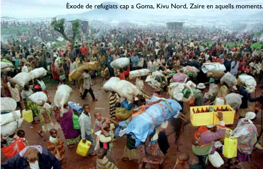
Èxode de refugiats cap a Goma, Kivu Nord, Zaire en aquells moments.

Grup d'Estudi de les Societats Africanes (GESA) Universitat de Barcelona