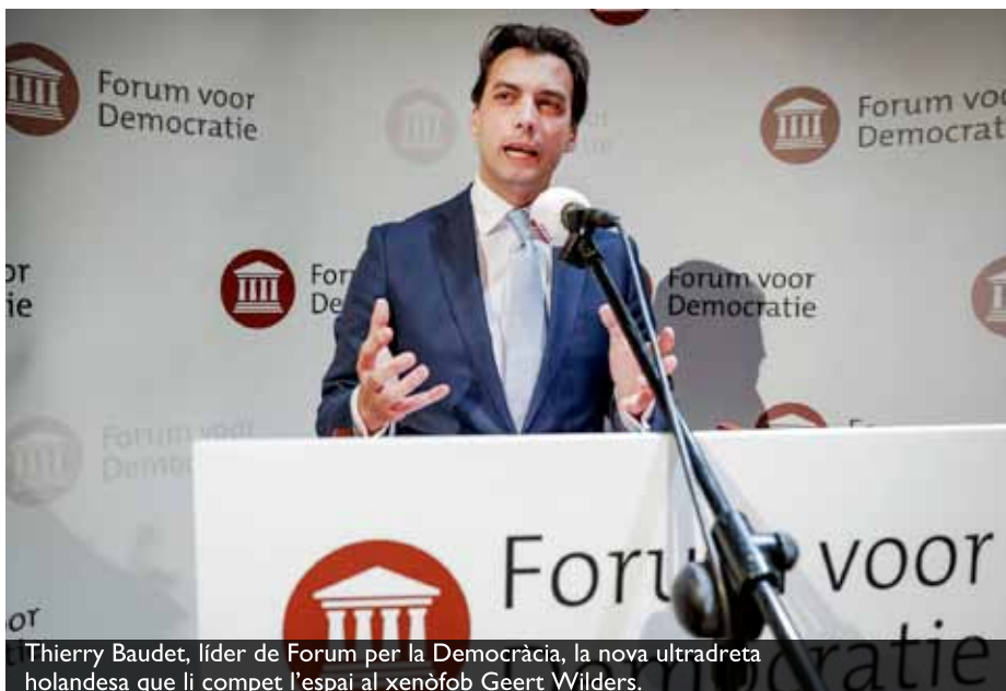
Thierry Baudet, líder de Forum per la Democràcia, la nova ultradreta holandesa que li compet l'espai al xenòfob Geert Wilders.

21 partits d'extrema dreta seran presents aquesta legislatura al Parlament Europeu. 135 de 751 escons. Afortunadament han obtingut menys representació del que auguraven algunes enquestes i prospeccions. I pel seu nombre no podran bloquejar l'Eurocambra, però sí condicionar les seves polítiques, sobretot si troben aliats euroescèptics com el Moviment 5 Estrelles italià que, tot i el seu discurs amb tocs ecologistes i assemblearis, que per alguns va arribar a ser considerat d'esquerra, no va tenir cap problema per formar govern a Itàlia amb la Lliga de Matteo Salvini, sense oposar-se a les seves polítiques i discursos vers la immigració i la criminalització de les ONG que rescaten immigrants a la Mediterrània.