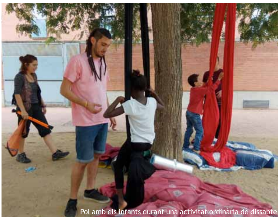
Pol amb els infants durant una activitat ordinària de dissabte

Pati: Abraçades, petons... també és que hi ha molta confiança amb nosaltres. I ens expliquen moltes coses, que després sabem per les famílies, tinguin 5 anys o en tinguin 15. És una relació molt fraternal també.