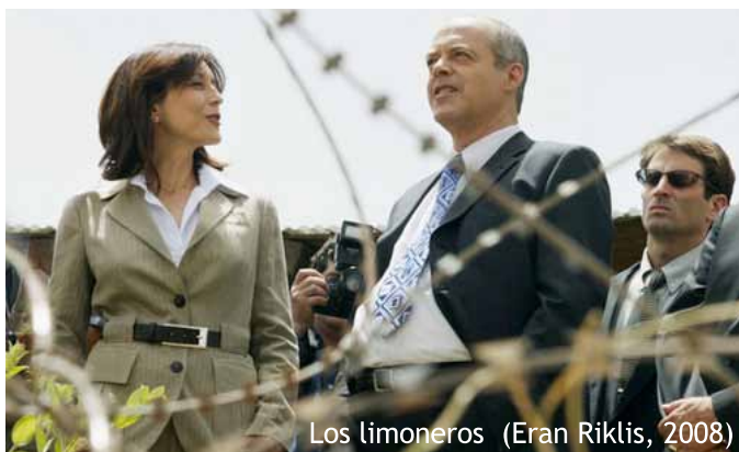
Los limoneros (Eran Riklis, 2008)

Però mentre Muna aguanta estoicament la duresa de ser una immigrant palestina a un poble d'Illinois en la lluita diària de trobar una feina, Salma, la protagonista de Los limoneros (Eran Riklis, 2008) "lluita" ni més ni menys que contra el ministre de defensa i la seva dona. Els seus veïns.