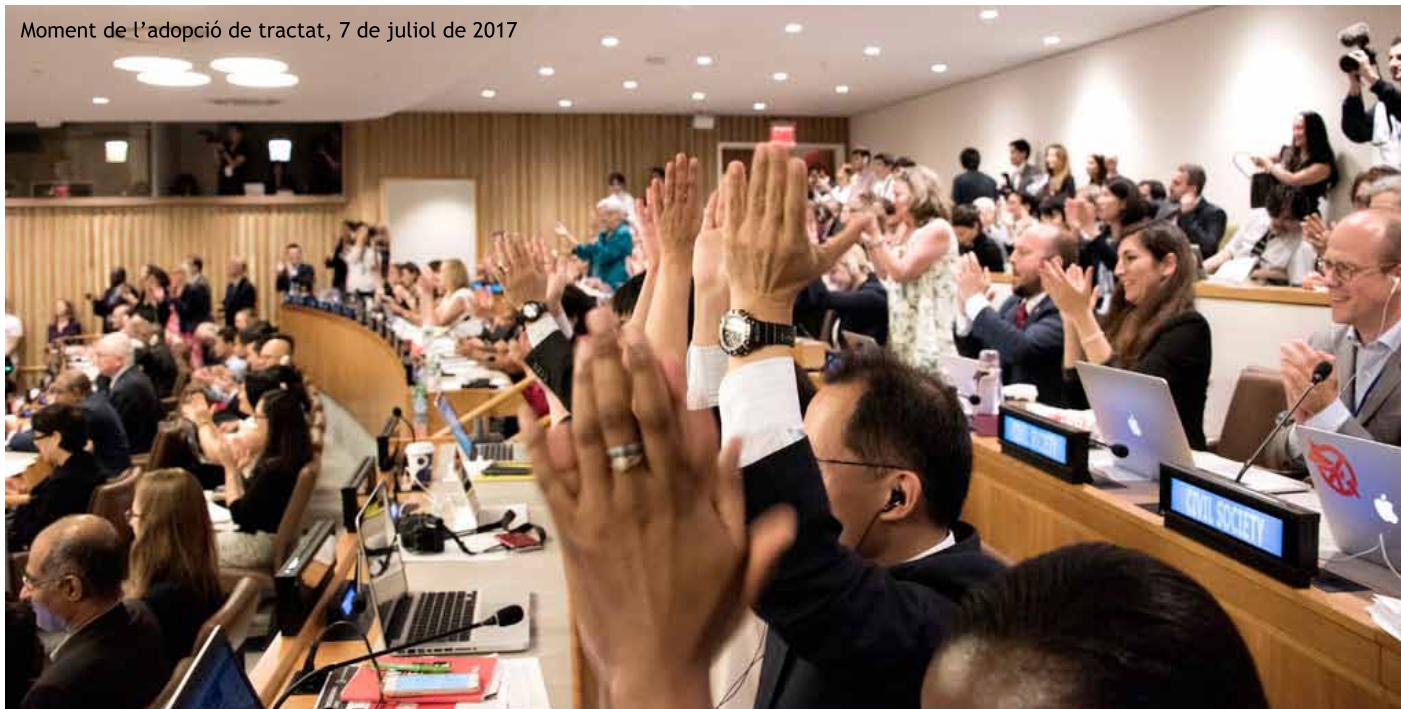
Moment de l'adopció de tractat, 7 de juliol de 2017

El 6 d'agost de 1945, els EUA van llançar una bomba nuclear sobre la ciutat d'Hiroshima. Tres dies més tard, van llançar una segona bomba sobre la ciutat de Nagasaki. Han estat les dues úniques ocasions en què s'han utilitzat armes nuclears contra la població. Les conseqüències catastròfiques són prou conegudes i encara perduren fins el dia d'avui.